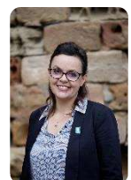
Gaëlle Lévêque, Maire de Lodève

L'îlot vert de la Soulandres a été retenu par l'équipe municipale suite à un appel à projet sur un terrain acheté par l'EPF à la demande de la commune. Ce projet répond aux enjeux de la rénovation urbaine de Lodève. Il permet de réhabiliter une friche à proximité du centre-ville tout en mettant en valeur un terrain bordant la rivière Soulandres par du maraîchage et des jardins. L'équipe s'est donnée des ambitions fortes en terme de gestion de l'énergie et d'usages de matériaux biosourcés. Le volet coopératif de la démarche double l'intérêt environnemental par un volet social. Lodève est une ville d'innovation écologique et sociale.»